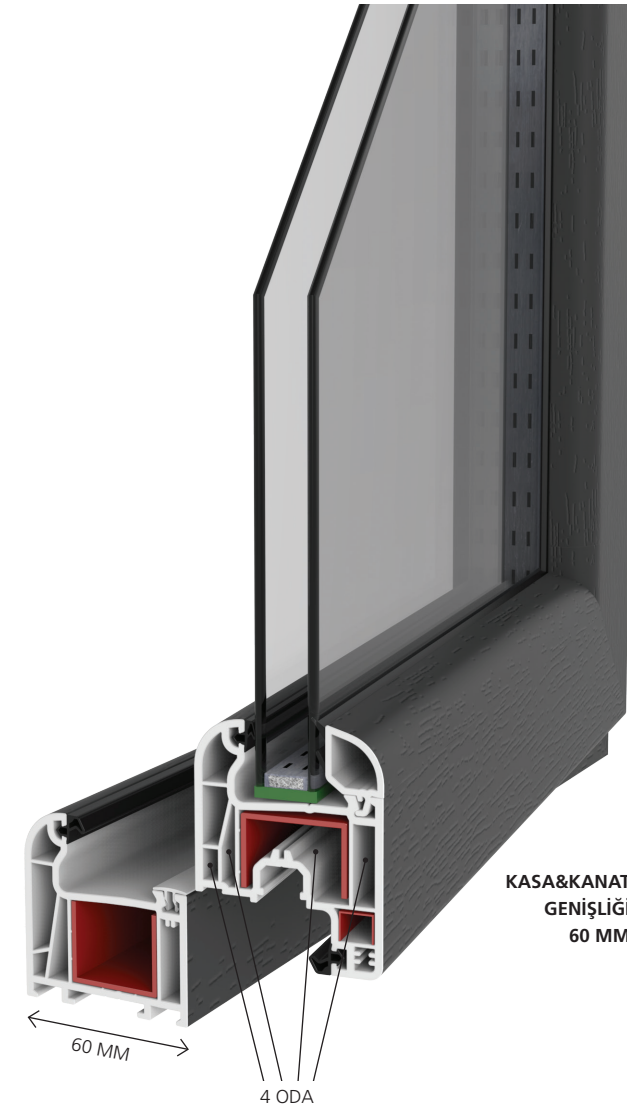
KASA&KANAT GENİŞLİĞİ 60 MM

Pencere Isı Akış Diyagramı Uf: 1,46 W/m 2 °K Uw: 1,63 W/m 2 °K