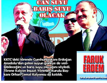
KKTC'deki törende Cumhurbaşkanı Erdoğan Anadolu'dan gelen suyun güneye de verilebileceğini ve barış suyu olacağını söyledi. Törene Kalyon İnşaat Yönetim Kurulu Başkanı Orhan Cemal Kalyoncu da katıldı.